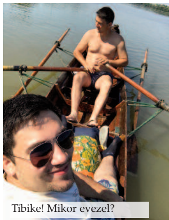
Tibike! Mikor evezel?