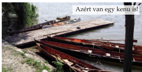
Azért van egy kenu is!