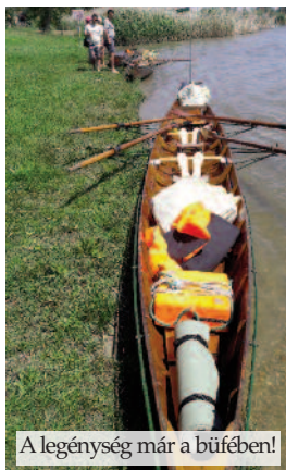
A legénység már a büfében!