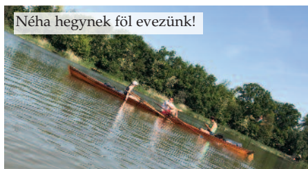
Néha hegynek föl evezünk!